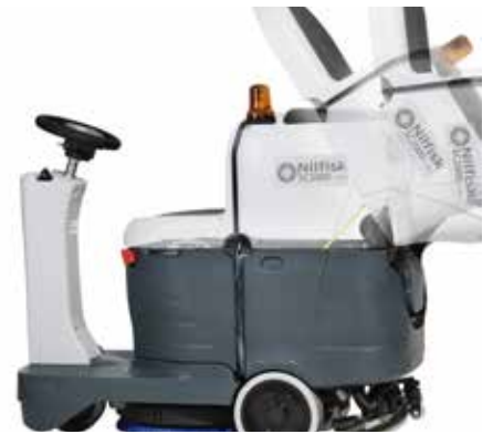
Kallistuva likavesisäiliö helpottaa akkutilaan ja Ecoflex-järjestelmään pääsyä.